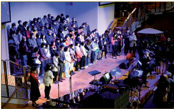
呼召決志者到台前，牧師帶他們決志禱告的一刻

佈道會在12月3日假於播道會恩福堂舉行實體佈道聚，超過一千人參加，看見神使用佈道會，藉著詩歌頌唱與見證分享，彰顯神的大愛，將人冰冷的心溶化，帶領有30位新朋友信主！10位願認識主更多！2位基督徒願意重新立志跟隨主。聖誕音樂佈道會並於12月26日在網上播放。